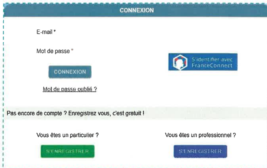
Interface de connexion

Il est nécessaire de fournir une adresse courriel valide lors de la création du compte.